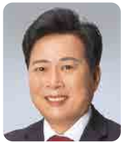
김 중 군 의원